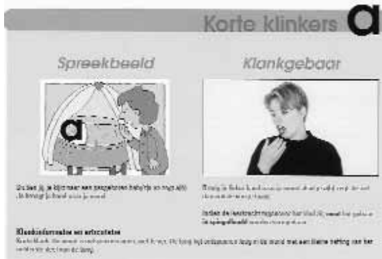
Een bladzijde uit het werkboek van Spreekbeeld.